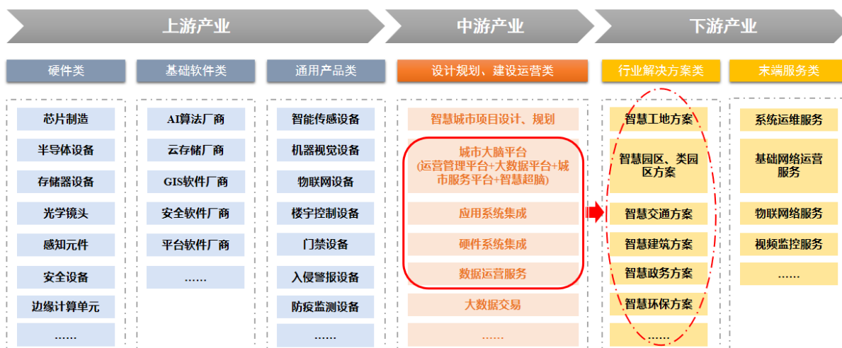
图注：倍智智能的定位居于产业链中游红色框线部分和下游椭圆虚线部分，且下游产业中解决方案所需能力由中游框线部分提供。

公司控股子公司倍智智能的定位是作为成都高新区开展智慧城市业务的重要平台载体，为成都高新区智慧城市建设落地做场景供给，立足于成都高新区并将逐步走出成都高新区，充分发掘成都高新区、成都市及更大范围内的智慧城市建设、运营及相关服务业务的应用场景，成为拥有自主知识产权和核心竞争力的智慧城市解决方案提供商和数据运营服务商。目前倍智智能处于智慧城市产业链中下游（图3-1），其业务发展方向是为政府、企业和社会提供智慧政务、智慧交通、智慧环保、智慧应急、智慧维稳、智慧公安、智慧园区、智慧教育、智慧医疗、智慧社区等一系列整体化解决方案和数据治理运营服务，以“运营服务”为动力，通过占领更多场景形成自有的大数据核心产品和竞争能力，同时聚集国内产业链相关的硬件、软件企业作为生态合作伙伴，构建强大的智慧城市生态圈，打造智慧城市软件基础设施以及数据处理中枢，赋能下游智慧城市场景应用，用数据联结产业生态全要素，用科技构建城市生活新场景，逐步成为具备投、建、管、运、营能力的新型智慧城市建设运营商。并在此基础上，通过投资并购、合资合作等各种形式向中上游高度相关的物联网、传感器、新一代信息技术、高端软件等领域进行产业链拓展，力争让高新发展在新型智慧业务细分领域具有领先地位。